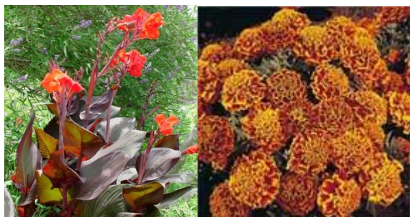
17. Városkapu virágtartóiba 3m 2