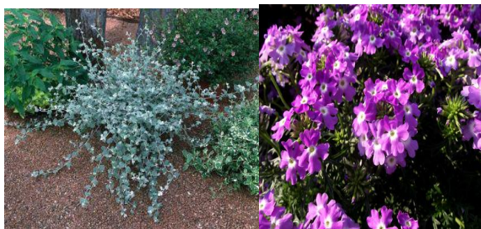
18. Városkapu előtti virágládákba 4 m 2