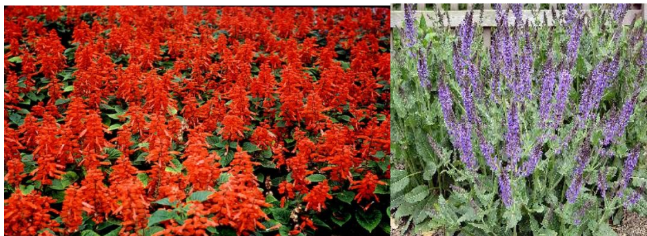
4. Takarékszövetkezet előtt 15 m 2