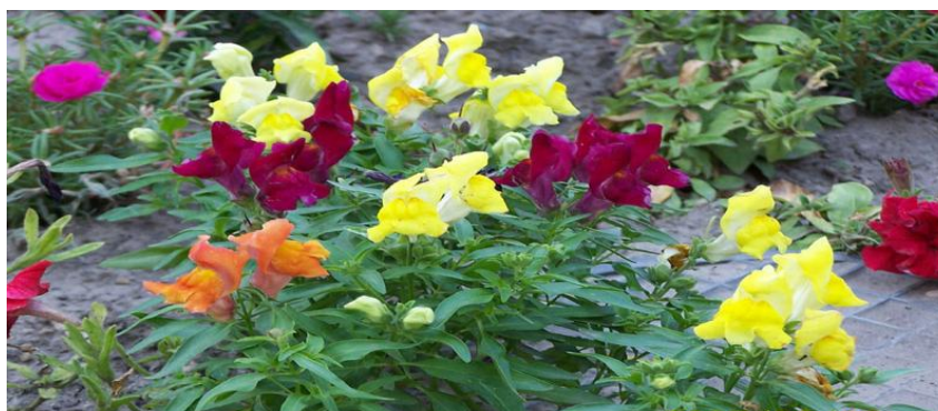
5. Templom mellett a haranglábnál 18 m 2