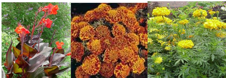
16. Vasútállomás R+R parkoló területe 5m 2