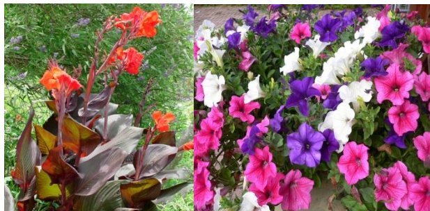
15. Vasútállomás biciklitároló előtti virágágyás 8m 2